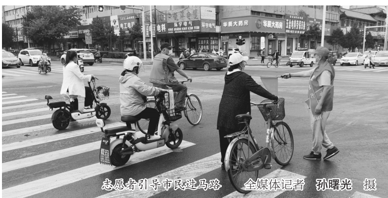
志愿者引导市民过马路

本报讯(夏贺春 全媒体记者孙曙光)“文明出行,请看红绿灯!”“请您慢点,看红绿灯,走斑马线!”8月26日16时10分,绥化市北林区雷锋志愿者协会志愿者孙会民来到市区长江路中兴东大街口“执勤”,协助交警疏导交通,与他一起来的还有4个志愿者“战友”。